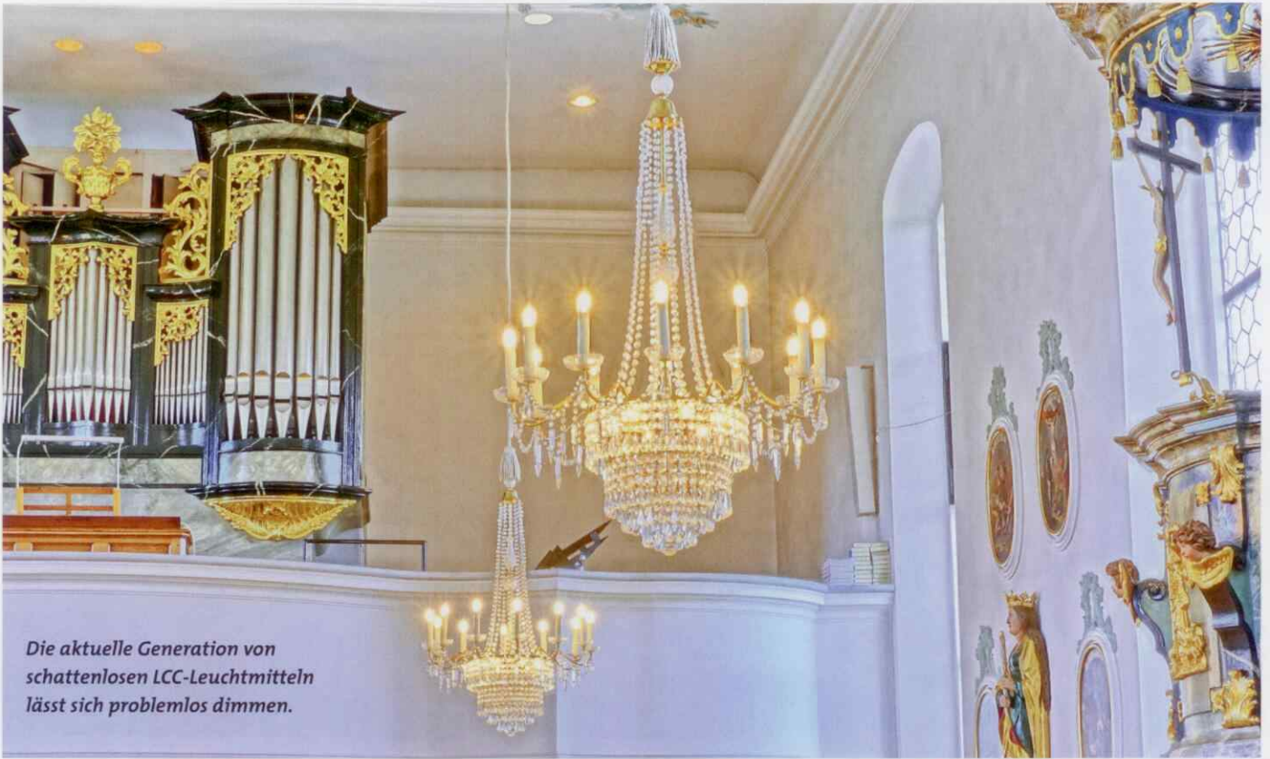
Die aktuelle Generation von schattenlosen LCC-Leuchtmitteln lässt sich problemlos dimmen.

nötigte, was neben den Stromkosten auch die Unterhaltskosten in die Höhe trieb.