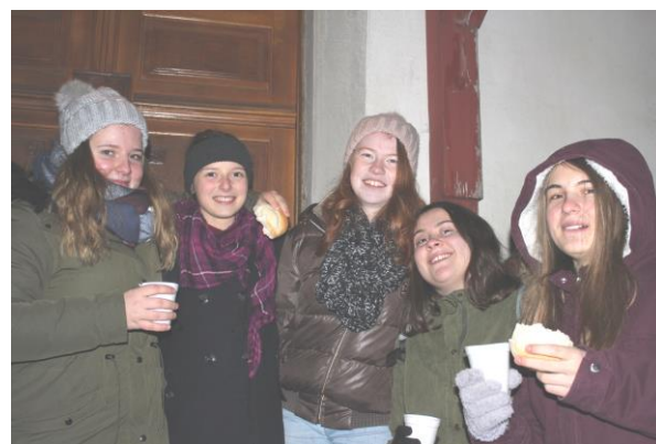
Die Firmandinnen beim Geniessen von Punch, Mutschli und Schoggistängeli (Text und Foto: U. Furrer)